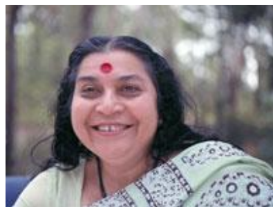
Shri Mataji Nirmala Devi

Sur l'arbre de la vie, il y a eu, jusqu'à ce jour, bien peu de fleurs, mais maintenant la saison de la floraison est arrivée. Le parfum du désir a collectivement matérialisé la manifestation de Sahaja Yoga. Beaucoup entreront dans le royaume de la conscience méta-mentale, où vous faites connaissance avec vous-mêmes et commencez à vous identifier avec votre nature universelle. Ceux qui le méritent obtiendront le trône de leur être intérieur, qui règne sur les cieux de la paix et sur les ondes de l'Amour Divin. Et ils obtiennent aussi à suprême connaissance intérieure, qui est infinie.